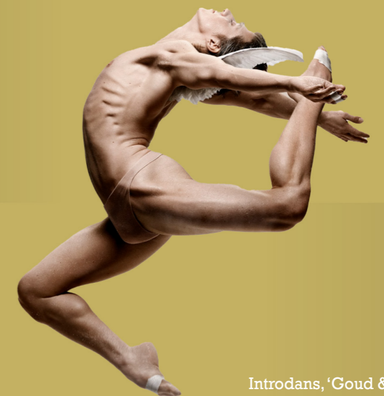
Introdans, ‘Goud & Nieuw’

Zie voor meer informatie dirkzwager.nl/events .