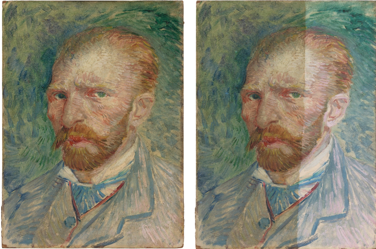
Het Zelfportret van Vincent van Gogh vóór (links) en na reiniging

een mengsel van rood met blauw. Na verbleking van het rood blijft het blauw over. En de roze hooglichten zijn verbleekt naar lichtroze of wit. Deze verkleuringen zien we helaas bij meer schilderijen van Van Gogh.”